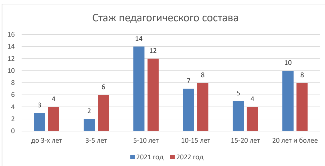
Рисунок 3. Стаж педагогического состава

В учреждении созданы условия для участия педагогов в конкурсах на различных уровнях.